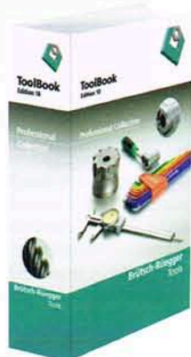
ToolBook, Edition 18 Der grosse Werkzeugkatalog mit dem Vollsoriment auf 3200 Seiten Kennziffer 01.03