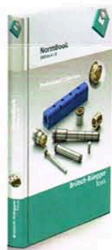
NormBook, Edition 4 Kennziffer 02.03