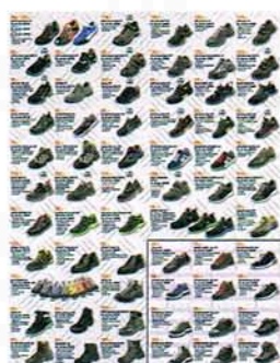
Sicherheitsschuhe – Poster Kennziffer 04.03