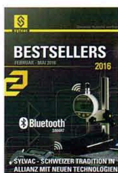
SYLVAC Bestsellers Kennziffer 03.03