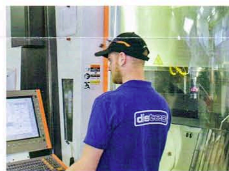
Topleute an Bearbeitungszentren der neuesten Generation bis hin zu fünf-Achsen-Fräsmaschinen