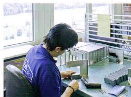
Die Montage von Komponenten bis hin zu fertigen Baugruppen gehört zum Distec-Angebot