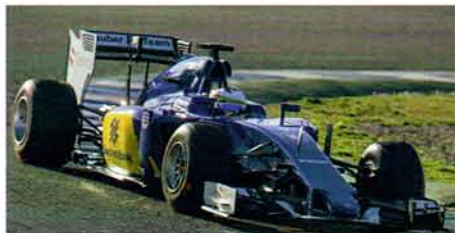
Brütsch/Rüegger Tools Promotional Partner of Sauber F1 Team