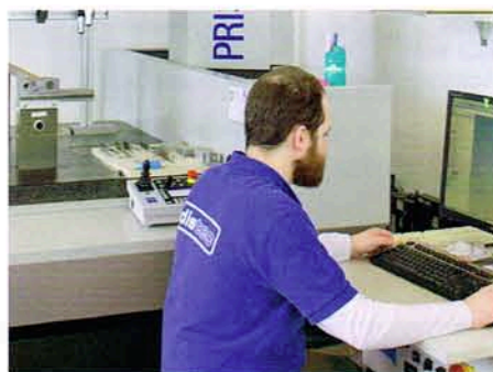
Der klimatisierte Messraum mit 3D-Anlage ist Referenzstelle während des ganzen Produktionsprozesses