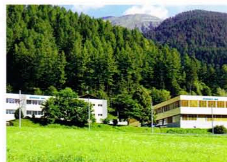
Die beiden Hauptgebäude der Distec AG, Disentis

Distec AG, CH-7180 Disentis Telefon +41 (0)81 929 52 00 www.distec.ch, info@distec.ch