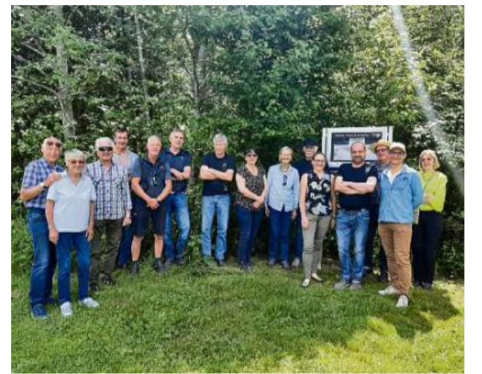
La gruppa ch'ei sentupada, avon la tabla da partenza dalla senda d'art.

«Igl ei la secunda gada che nus havein organisau ina tala sentupada», ha Wendelin Decurtins confirmau alla FMR. Sonda vargada ha el astgau beneventar ell'ustria Ogna dil campadi Trun ina roscha personas, oravontut artistas ed artists. El ei responsabels per in'exposiziun sut tschiel aviert ch'ei frequentada stediamein d'indigens e hospes.