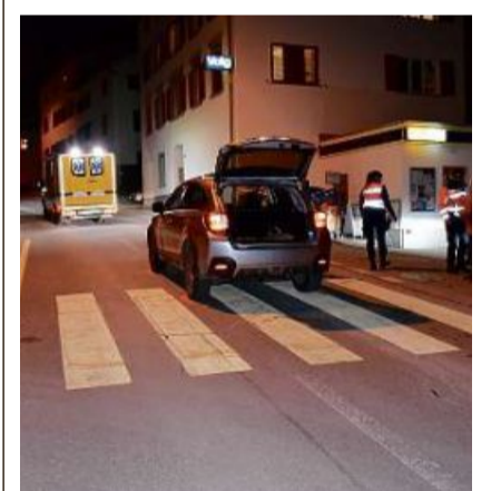
Il liug digl accident a Trin Vitg. MAD