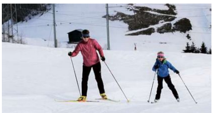
Segnas dispona d'in bi trassé per ina purschida da cuorsa liunga.